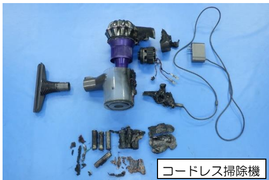
コードレス掃除機

1階にいた建物の住人が、上階で大きな音がしたことから各階を確認したところ、3階のベッド付近から炎が上がっているのを発見したため、119番通報をしています。