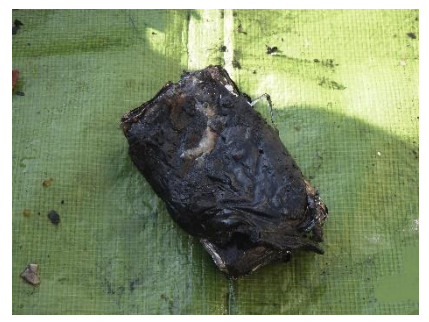
写真 1-3 潰れて燃えた充電式電池