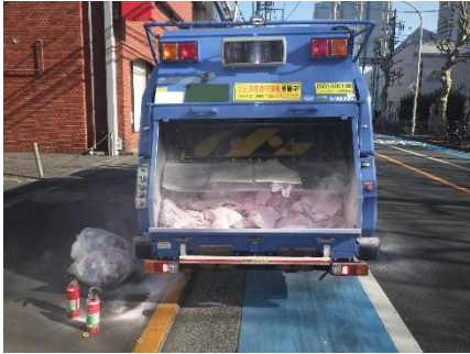
写真 1-1 焼損した清掃車

この火災は、可燃ごみに混ざって廃棄された充電式電池が押し潰されたため、充電式電池内で短絡を起こし、出火したものです。作業員は、路上で可燃ごみ回収作業中に後方の荷