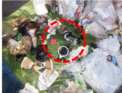
写真 1-2 荷箱内の燃えたごみ